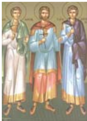
Άγιοι Τρόφιμος, Σαββάτιος και Δορυμέδων