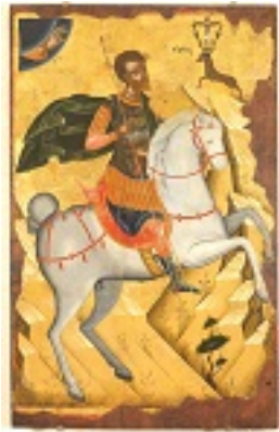
Άγιος Ευστάθιος - άγνωστος Κρητικός ζωγράφος, αρχές 16ου αιώνα μ.Χ.