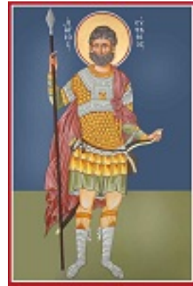
Άγιος Ευστάθιος - Καζακίδου Μαρία© (byzantineartkazakidou.blogspot.com)