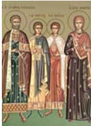
Άγιος Ευστάθιος και η συνοδεία του, Θεοπίστη η σύζυγος του, Αγάπιος και Θεόπιστος τα παιδιά του