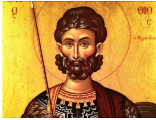
Ακούστε το απολυτίκιο!