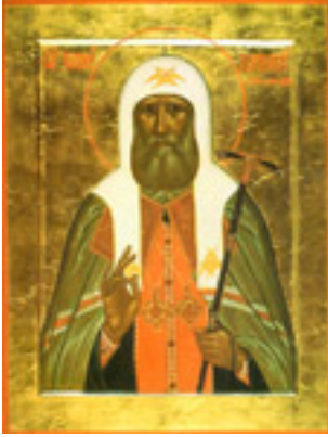
Άγιος Τύχων Πατριάρχης Μόσχας