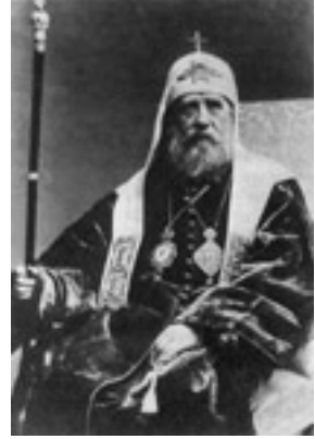
Άγιος Τύχων Πατριάρχης Μόσχας