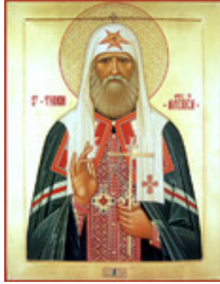
Άγιος Τύχων Πατριάρχης Μόσχας