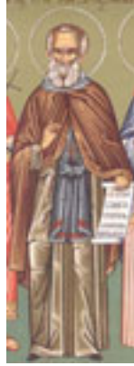
Όσιος Μάξιμος ο Ομολογητής