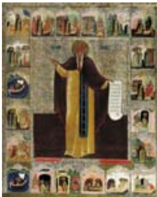
Όσιος Μάξιμος ο Ομολογητής