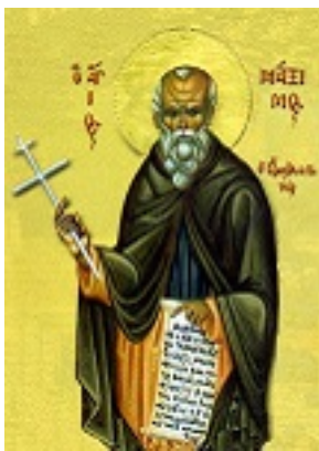
Όσιος Μάξιμος ο Ομολογητής