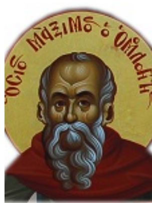
Όσιος Μάξιμος ο Ομολογητής