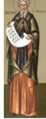
Όσιος Μάξιμος ο Ομολογητής