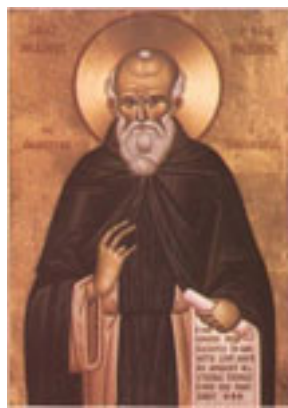
Όσιος Μάξιμος ο Ομολογητής