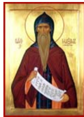
Όσιος Μάξιμος ο Ομολογητής