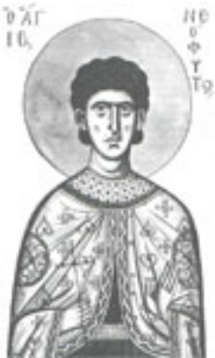
Άγιος Νεόφυτος ο Μάρτυρας