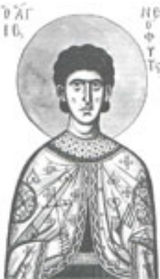
Άγιος Νεόφυτος ο Μάρτυρας