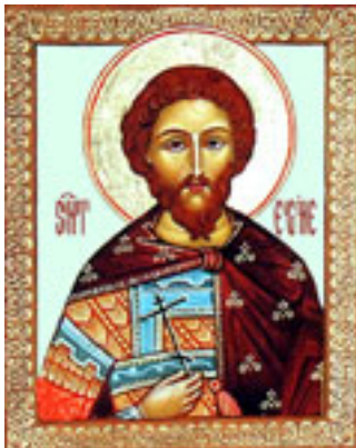
Άγιος Ευγένιος ο πολιούχος της Τραπεζούντας