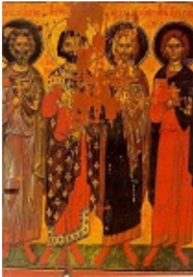
Άγιοι Ευγένιος, Ουαλεριανός, Κάντιδος και Ακύλας οι εκ Τραπεζούντας (Ο άγιος Ευγένιος φέρει χρυσό φωτοστέφανο αντί βαθυκύανο) - γύρω στα 1375 μ.Χ. - Μονή Διονυσίου, Άγιον Όρος