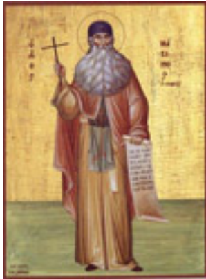
Άγιος Μάξιμος ο Γραικός