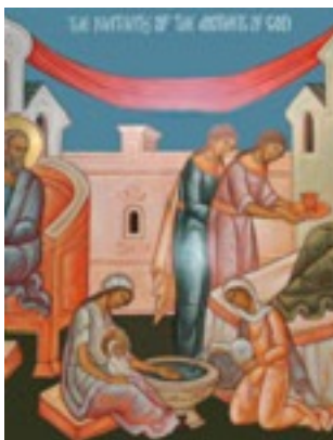
Γέννηση της Υπεραγίας Θεοτόκου