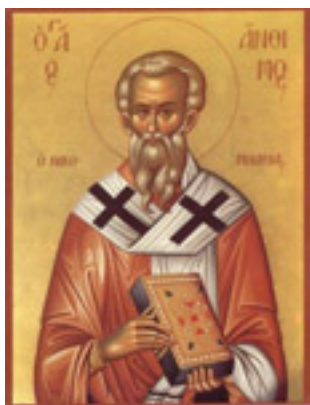
Άγιος Άνθιμος<br />Ιερομάρτυρας<br />επίσκοπος Νικομήδειας