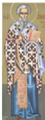
Άγιος Άνθιμος<br />Ιερομάρτυρας<br />επίσκοπος Νικομήδειας