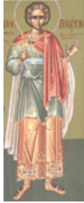
Άγιος Πολύδωρος ο Νεομάρτυρας από τη Λευκωσία