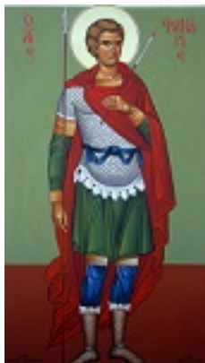
Άγιος Φανούριος ο Νεοφάνης, ο Μεγαλομάρτυρας - Μιχαήλ Χατζημιχαήλ