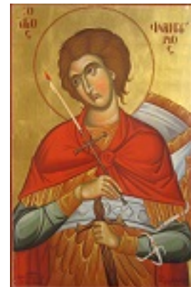
Άγιος Φανούριος ο Νεοφάνης, ο Μεγαλομάρτυρας - Μιχαήλ Χατζημιχαήλ© www.michaelhadjimichael.com