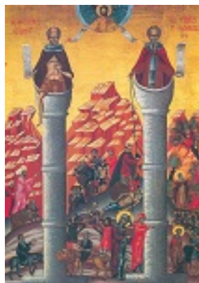
Όσιος Συμεών ο Στυλίτης και Όσιος Συμεών ο Θαυμαστορείτης