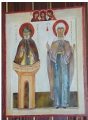
Όσιος Συμεών ο Στυλίτης και Αγία Genevieve των Παρισίων