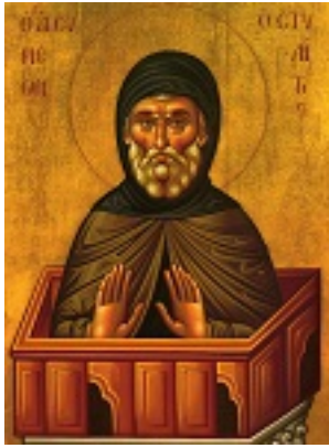
Όσιος Συμεών ο Στυλίτης