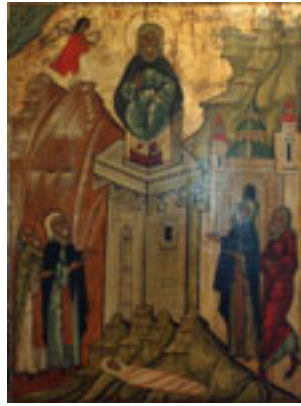
Όσιος Συμεών ο Στυλίτης