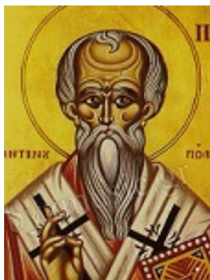
Άγιος Παρθένιος ο Γ (ή Παρθενάκης) Πατριάρχης Κωνσταντινούπολης