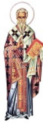
Άγιος Πέτρος ο Θαυματουργός Αρχιεπίσκοπος Άργους και Ναυπλίου