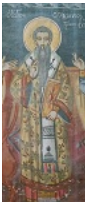
Άγιος Οικουμένιος ο Θαυματουργός επίσκοπος Τρίκκης