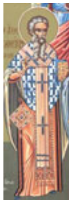
Άγιος Οικουμένιος ο Θαυματουργός επίσκοπος Τρίκκης