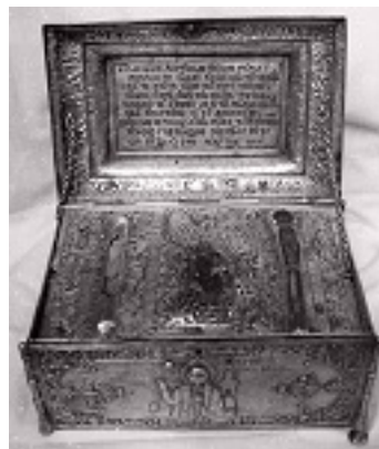
Θήκη με τα Ιερά Λείψανα του Αγίου Οικουμένιου του Θαυματουργού επισκόπου Τρίκκης