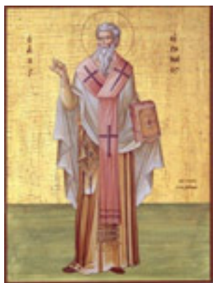
Άγιος Ειρηναίος Επίσκοπος Λουγδούνου