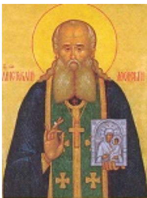
Όσιος Αριστοκλής ο Αθωνίτης