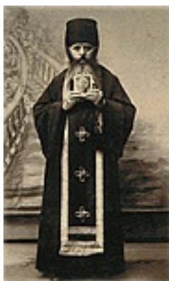
Όσιος Αριστοκλής ο Αθωνίτης