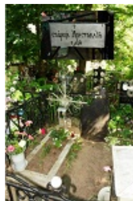
Ο τάφος του Οσίου Αριστοκλή του Αθωνίτη