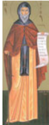
Άγιος Κοσμάς ο Αιτωλός