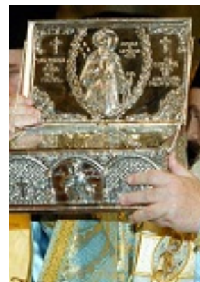
Άγιος Κοσμάς ο Αιτωλός