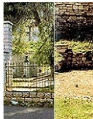
Τα θεμέλια από την οικία του Αγίου Κοσμά στο Μέγα Δένδρο του Αιτωλού