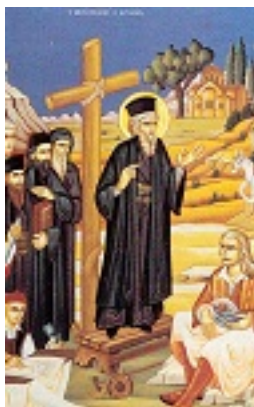
Ο Άγιος Κοσμάς κηρύττων