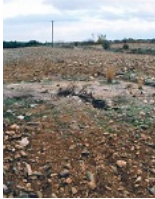
Καταλοίπο βασιλικής του Αγίου Αρτέμονος με μωσαϊκό δάπεδο, Αυλώνα