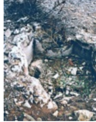
Κατάλοιπο του βαπτιστηρίου στη βασιλική του Αγίου Αρτέμονος, Αυλώνα