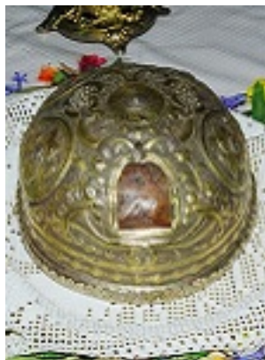
Ἡ Τίμια Κάρα του Ὁσίου Δανιήλ του Μετρωίτη