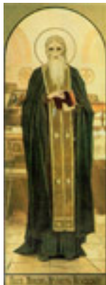
Όσιος Νίκων καθηγούμενος της Λαύρας των Σπηλαίων του Κιέβου