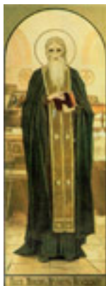
Όσιος Νίκων καθηγούμενος της Λαύρας των Σπηλαίων του Κιέβου