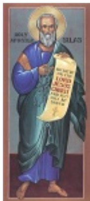
Άγιος Σίλας ο Απόστολος