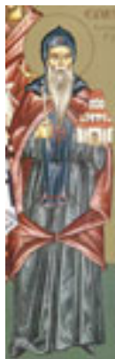
Όσιος Συμεών Κτήτορας της Μονής Χιλανδαρίου Αγίου Όρους