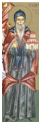
Όσιος Συμεών Κτήτορας της Μονής Χιλανδαρίου Αγίου Όρους