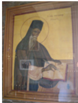
Όσιος Νικόδημος ο Αγιορείτης