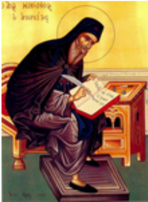
Όσιος Νικόδημος ο Αγιορείτης