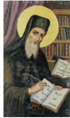
Όσιος Νικόδημος ο Αγιορείτης