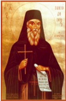
Όσιος Νικόδημος ο Αγιορείτης