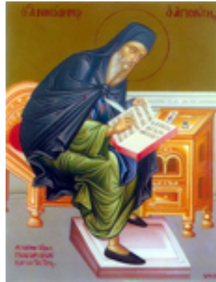
Όσιος Νικόδημος ο Αγιορείτης