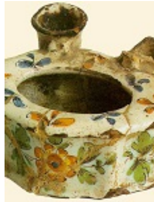
Το μελανοδοχείο του οσίου Νικοδήμου του Αγιορείτου - τέλος 18ου αι. μ.Χ. - Μονή Βατοπαιδίου, Άγιον Όρος