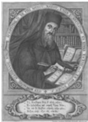
Όσιος Νικόδημος ο Αγιορείτης - Ιωάννης Αντώνιος Ζουλιάνης εχάραξε. 1818 Venezia