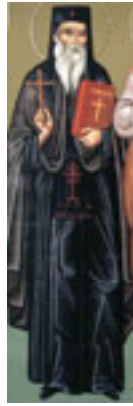
Όσιος Νικόδημος ο Αγιορείτης