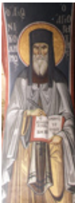
Όσιος Νικόδημος ο Αγιορείτης