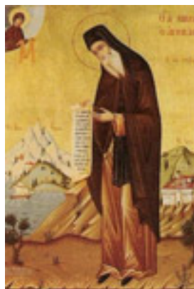
Όσιος Νικόδημος ο Αγιορείτης