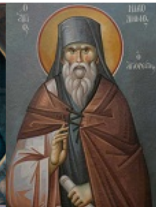
Όσιος Νικόδημος ο Αγιορείτης