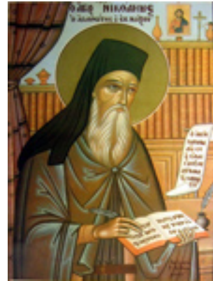
Όσιος Νικόδημος ο Αγιορείτης