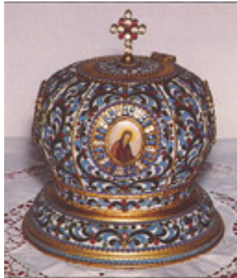
Λειψανοθήκη με λείψανο του Αγίου Νικοδήμου του Αγιορείτη