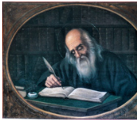
Όσιος Νικόδημος ο Αγιορείτης