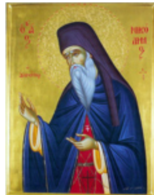
Όσιος Νικόδημος ο Αγιορείτης