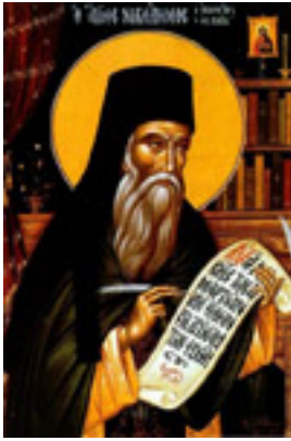
Όσιος Νικόδημος ο Αγιορείτης