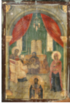
Η Περιτομή του Κυρίου και ο Άγιος Βασίλειος - Ι.Ν. Ζωοδόχου Πηγής, Λαρίσης ( http://www.panagialarisis.gr )