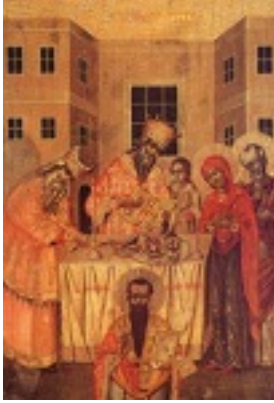
Η Περιτομή του Κυρίου και ο Άγιος Βασίλειος - Ι. Μ. Αγίου Παντελεήμονος (Ρωσικόν), Άγιο Όρος