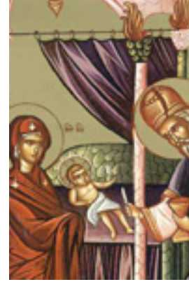
Περιτομή του Κυρίου