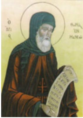
Όσιος Θωμάς ο εν Μαλεώ