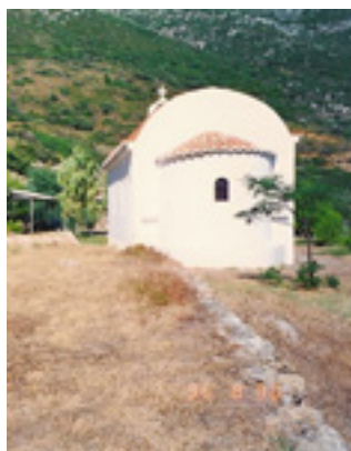
Πίσω από τον Ιερό Ναό του Οσίου<br />Θωμά του εν τω Μαλεώ