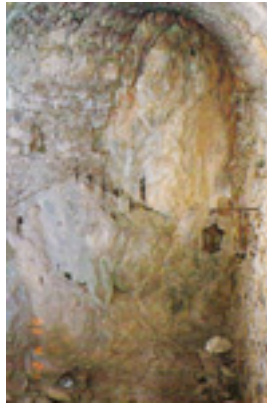
Το εσωτερικό του προσβάσιμου<br />ασκητηρίου του Οσίου Θωμά<br />του εν τω Μαλεώ