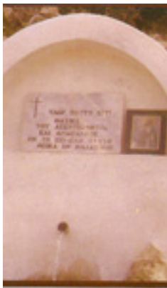
Η πηγή Αγιάσματος του Οσίου<br />Θωμά του εν Μαλεώ