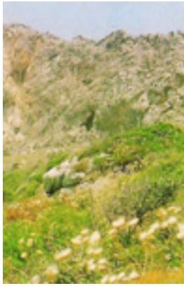
Το δυσπρόσιτο ασκητήριο του<br />Οσίου Θωμά του εν τω Μαλεώ<br />από μακριά (είναι η σπηλιά<br />στο κέντρο της<br />φωτογραφίας)