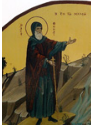
Όσιος Θωμάς ο εν Μαλεώ