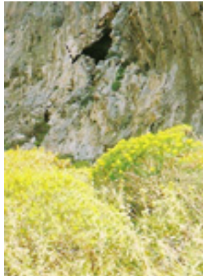
Το δυσπρόσιτο ασκητήριο του<br />Οσίου Θωμά του εν τω Μαλεώ<br />από μακριά