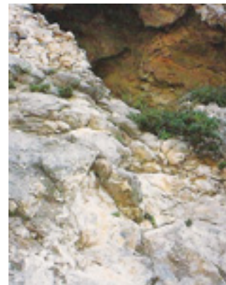
Η είσοδος του δυσπρόσιτου<br />ασκητηρίου του Οσίου Θωμά<br />του εν τω Μαλεώ