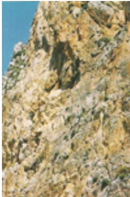
Τα βράχια κοντά στο δυσπρόσιτο<br />ασκητήριό του Οσίου Θωμά<br />του εν τω Μαλεώ