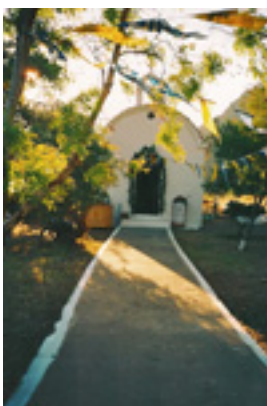
Ο Ιερός Ναός του Οσίου Θωμά<br />του εν τω Μαλεώ