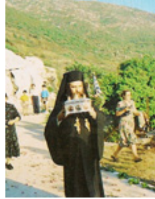
Ο Μητροπολίτης Μονεμβασίας<br />και Σπάρτης κ.κ. Ευστάθιος,<br />μεταφέροντας στο χωριό<br />Βελανίδια τη λειψανοθήκη με<br />τα άγια Λείψανα του Αγίου<br />Θωμά του εν Μαλεώ το 1990 μ.Χ.