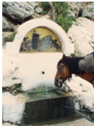
Η πηγή Αγιάσματος του Οσίου<br />Θωμά του εν Μαλεώ