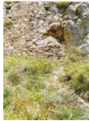
Το εξωτερικό του προσβάσιμου<br />ασκητηρίου του Οσίου Θωμά<br />του εν τω Μαλεώ