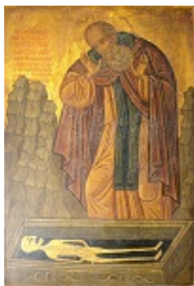
Όσιος Σισώης<br />ο μεγάλος