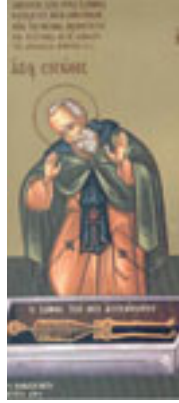
Όσιος Σισώης<br />ο μεγάλος