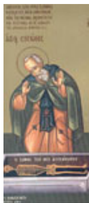
Όσιος Σισώης<br />ο μεγάλος