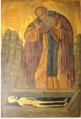
Όσιος Σισώης<br />ο μεγάλος