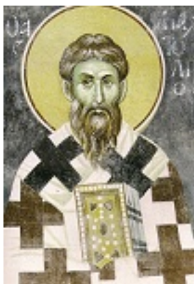
Άγιος Ανατόλιος Πατριάρχης Κωνσταντινούπολης