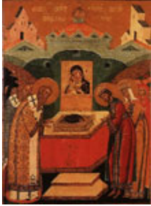
Κατάθεσις της Τιμίας Εσθήτος της Θεοτόκου