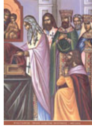
Κατάθεσις της Τιμίας Εσθήτος της Θεοτόκου