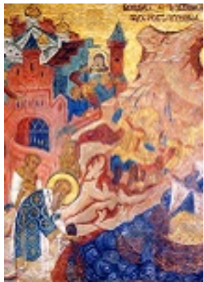
Κατάθεσις της Τιμίας Εσθήτος της Θεοτόκου (θαύμα λύσεως πολιορκίας 865)