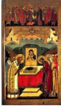
Κατάθεσις της Τιμίας Εσθήτος της Θεοτόκου