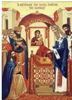
Κατάθεσις της Τιμίας Εσθήτος της Θεοτόκου