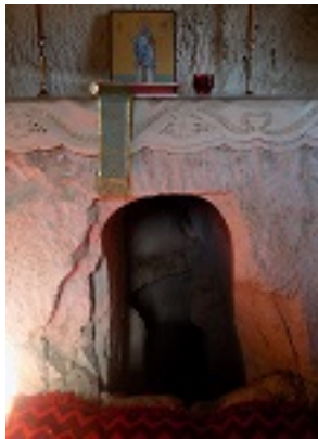
Το σπήλαιο - τάφος του Αγίου Ιουβενάλιου Πατριάρχου Ιεροσολύμων στα Ιεροσόλυμα, εντός της Μονής του Αγίου Ονουφρίου στην περιοχή του Σιλωάμ