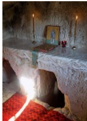
Το σπήλαιο - τάφος του Αγίου Ιουβενάλιου Πατριάρχου Ιεροσολύμων στα Ιεροσόλυμα, εντός της Μονής του Αγίου Ονουφρίου στην περιοχή του Σιλωάμ