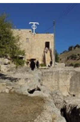
Το σπήλαιο - τάφος του Αγίου Ιουβενάλιου Πατριάρχου Ιεροσολύμων στα Ιεροσόλυμα, εντός της Μονής του Αγίου Ονουφρίου στην περιοχή του Σιλωάμ