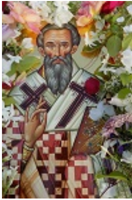
Άγιος Ιουβενάλιος Πατριάρχης Ιεροσολύμων