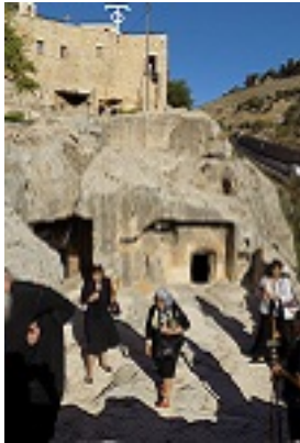
Το σπήλαιο - τάφος του Αγίου Ιουβεναλίου Πατριάρχου Ιεροσολύμων στα Ιεροσόλυμα, εντός της Μονής του Αγίου Ονουφρίου στην περιοχή του Σιλωάμ