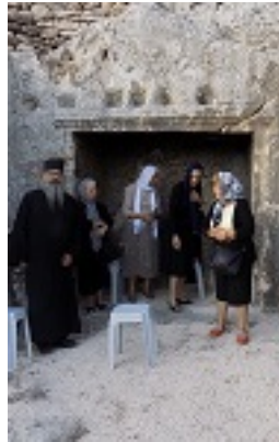
Το σπήλαιο - τάφος του Αγίου Ιουβεναλίου Πατριάρχου Ιεροσολύμων στα Ιεροσόλυμα, εντός της Μονής του Αγίου Ονουφρίου στην περιοχή του Σιλωάμ