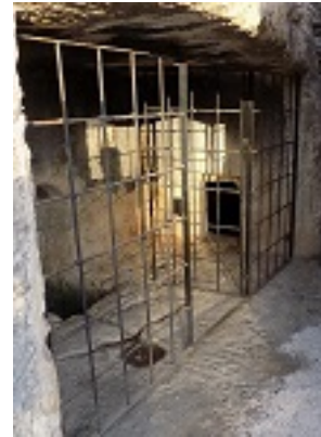
Το σπήλαιο - τάφος του Αγίου Ιουβεναλίου Πατριάρχου Ιεροσολύμων στα Ιεροσόλυμα, εντός της Μονής του Αγίου Ονουφρίου στην περιοχή του Σιλωάμ