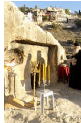
Το σπήλαιο - τάφος του Αγίου Ιουβενάλιου Πατριάρχου Ιεροσολύμων στα Ιεροσόλυμα, εντός της Μονής του Αγίου Ονουφρίου στην περιοχή του Σιλωάμ