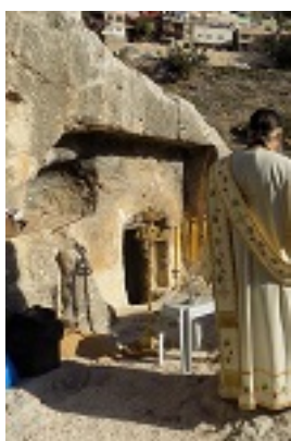
Το σπήλαιο - τάφος του Αγίου Ιουβενάλιου Πατριάρχου Ιεροσολύμων στα Ιεροσόλυμα, εντός της Μονής του Αγίου Ονουφρίου στην περιοχή του Σιλωάμ