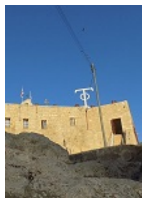
Το σπήλαιο - τάφος του Αγίου Ιουβενάλιου Πατριάρχου Ιεροσολύμων στα Ιεροσόλυμα, εντός της Μονής του Αγίου Ονουφρίου στην περιοχή του Σιλωάμ