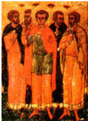
Άγιος Αγάπιος και των συν αυτώ μάρτυρες: Πλήσιος, Ρωμύλος, Τιμόλαος, Αλέξανδρος, Αλέξανδρος (έτερος), Διονύσιος και Διονύσιος (έτερος)