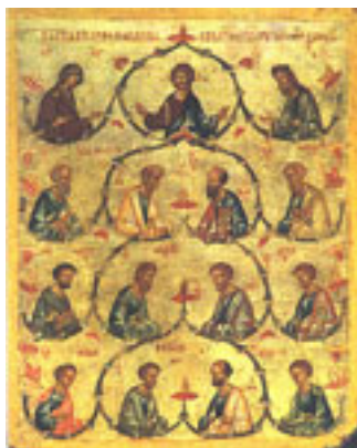
Οι Άγιοι Δώδεκα Απόστολοι