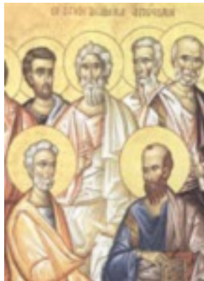
Οι Άγιοι Δώδεκα Απόστολοι