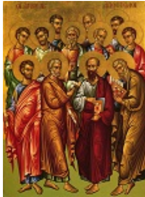
Οι Άγιοι Δώδεκα Απόστολοι