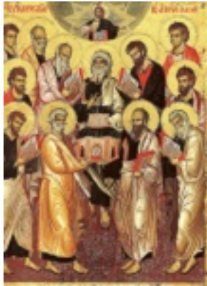
Οι Άγιοι Δώδεκα Απόστολοι (Ι.Μ. Καρακάλλου - Διονυσίου εκ Φουρνά 1722)