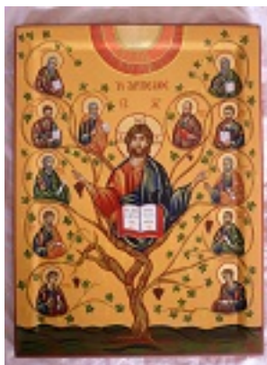
Οι Άγιοι Δώδεκα Απόστολοι