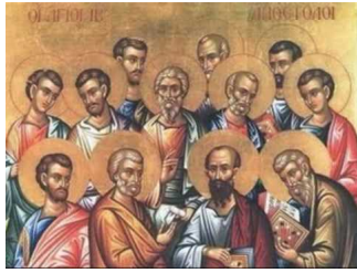
Ακούστε το απολυτίκιο!