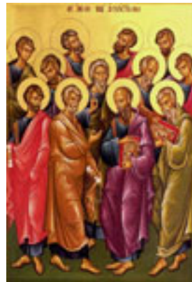
Οι Άγιοι Δώδεκα Απόστολοι