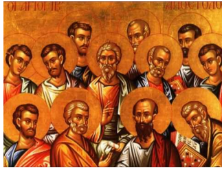
Ακούστε το απολυτίκιο!