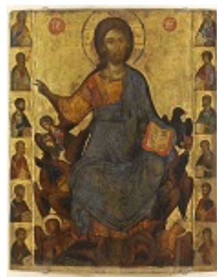
Ο Χριστός εν δόξη και οι δώδεκα Απόστολοι - άγνωστος ζωγράφος από την Κωνσταντινούπολη, μέσα 14ου αιώνα μ.Χ.