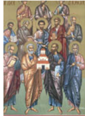
Οι Άγιοι Δώδεκα Απόστολοι