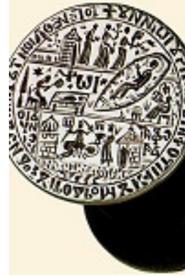
Σφραγίδα Μονής Διονυσίου με τις παράστασεις της Γεννήσεως του Προδρόμου και της Αποτομής της κεφαλής του Προδρόμου - 1636 μ.Χ. - Μονή Διονυσίου, Άγιον Όρος