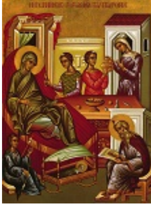
Το Γενέθλιο του Αγίου Ιωάννη Προδρόμου και Βαπτιστού