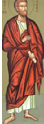
Άγιος Ιούδας ο Απόστολος