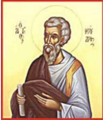
Άγιος Ιούδας ο Απόστολος