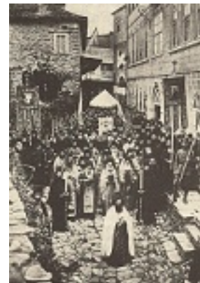
Λιτάνευση της Εικόνας «Άξιον Έστί»