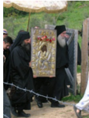
Λιτάνευση της Εικόνας «Άξιον Έστί»