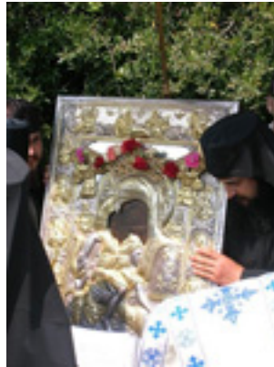
Λιτάνευση της Εικόνας «Άξιον Έστί»