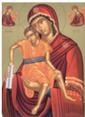
Σύναξη της Παναγίας «Άξιόν Εστί» (ή έν τῷ « Άδειν»)