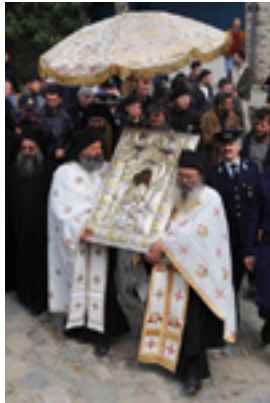
Λιτάνευση της Εικόνας «Άξιον Έστί»