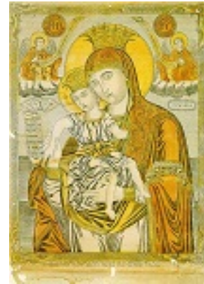
Παναγία το Άξιόν Εστίν - 1866 μ.Χ. - Συλλογή Μονής Σιμωνόπετρας, Άγιον Όρος