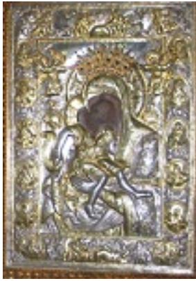
Η εφέστιος θαυματουργός εικόνα του Αγίου Όρους, «Άξιόν Εστιν», στο Πρωτάτο Καρυές