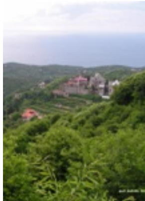
Το Ιερό Κελλί Άξιον Εστιν