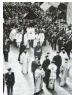
Πρώτη έξοδος της εικόνας «Άξιόν Εστί» από το Άγιο Όρος (1963 μ.Χ., Αθήνα)