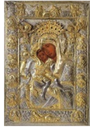
Σύναξη της Παναγίας «Άξιόν Εστί» (ή έν τῷ « Άδειν»)