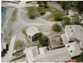
Ο Αγγελικός ύμνος Άξιον Εστί από Σιμωνοπετρίτες Πατέρες!