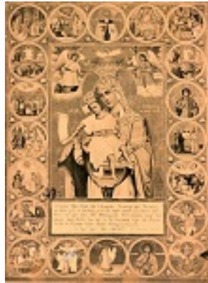
Άξιόν εστί. Η θαυματουργή εικόνα του Πρωτάτου - Έργο και φωτογραφία Βενιαμίν ιερομονάχου Κοντράκη (1872) - Συλλογή Αγιορειτικής Φωτοθήκης