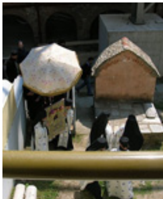
Λιτάνευση της Εικόνας «Άξιον Έστί»