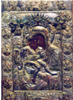
Σύναξη της Παναγίας «Άξιόν Εστί» (ή έν τῷ « Άδειν»)