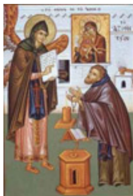
Σύναξη της Παναγίας «Άξιόν Εστί» (ή έν τῷ « Άδειν»)