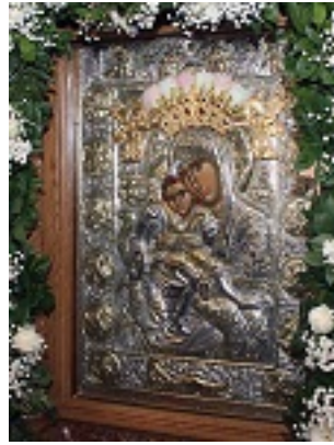
Σύναξη της Παναγίας «Άξιόν Εστί» (ή έν τῷ « Άδειν»)