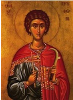
Άγιος Τρύφων ο Μάρτυρας