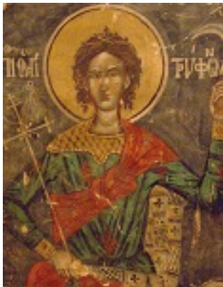
Άγιος Τρύφων ο Μάρτυρας