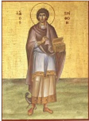
Άγιος Τρύφων ο Μάρτυρας