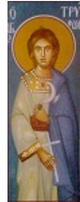
Άγιος Τρύφων ο Μάρτυρας

Άγιος Τρύφων ο Μάρτυρας - Ταπεινός αγρότης και ηρωικός μεγαλομάρτυρας, ο άγιος Τρύφων κρατάει το σταυρό (σύμβολο της αυτοθυσίας του) και το κλαδευτήρι, το εργαλείο της δουλειάς του, την οποία ευλογεί με τις ουράνιες προσευχές του