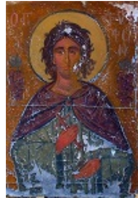
Άγιος Τρύφων ο Μάρτυρας