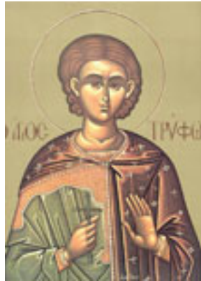
Άγιος Τρύφων ο Μάρτυρας