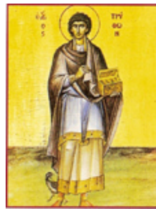
Άγιος Τρύφων ο Μάρτυρας - Ο άγιος Τρύφων εικονίζεται ως Ανάργυρος. Αν και δεν ήταν γιατρός, ο άγιος συμπεριλαμβάνεται στην ομάδα των αγίων Αναργύρων, λόγω του μεγάλου θαυματουργικού χαρίσματος που είχε ήδη όταν ζούσε, ιδιαίτερα κατά των δαιμόνων.