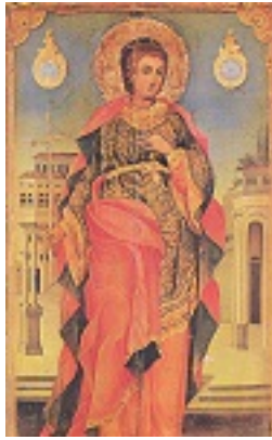
Άγιος Τρύφων ο Μάρτυρας