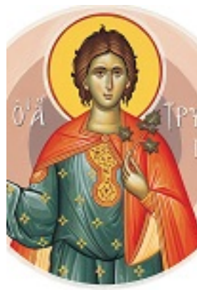
Άγιος Τρύφων ο Μάρτυρας