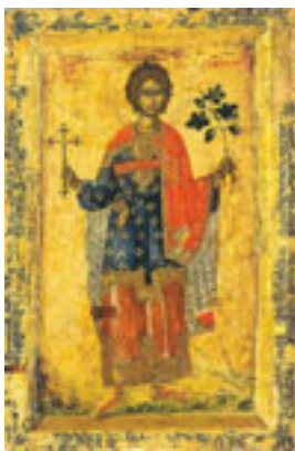
Άγιος Τρύφων ο Μάρτυρας