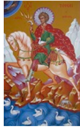
Άγιος Τρύφων ο Μάρτυρας - Μιχαήλ Χατζημιχαήλ© www.michaelhadjimichael.com