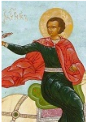
Άγιος Τρύφων ο Μάρτυρας