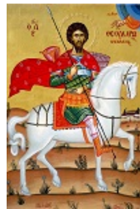
Άγιος Θεόδωρος ο Στρατηλάτης - Μιχαήλ Χατζημιχαήλ© www.michaelhadjimichael.com