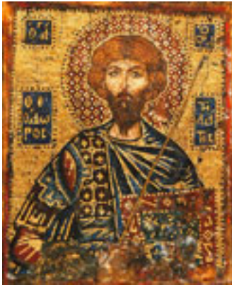
Άγιος Θεόδωρος ο Στρατηλάτης