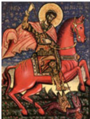
Άγιος Θεόδωρος ο Στρατηλάτης