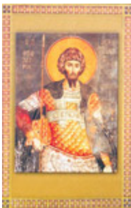
Άγιος Θεόδωρος ο Στρατηλάτης