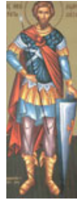
Άγιος Θεόδωρος ο Στρατηλάτης