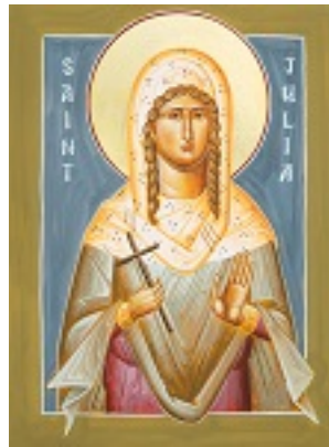
Αγία Ιουλία - Julia Hayes© ( www.ikonographics.net )