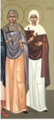
Αγίες Ευφρασία και Ιουλία