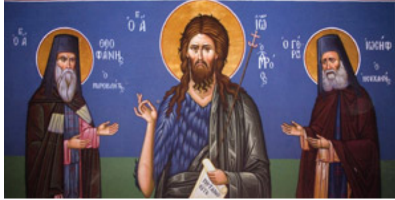
Δέησις των Οσίων Θεοφάνους του Μυροβλύτου και Ιωσήφ του Ησυχαστού στον Τίμιο Πρόδρομο (τοιχογραφία από την Πύλη της Μονής)