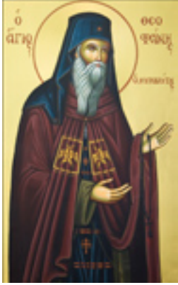
Όσιος Θεοφάνης ο<br />Μυροβλύτης