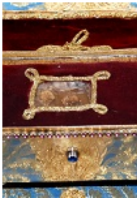
Η λειψανοθήκη του Οσίου Παναγής Μπασιά