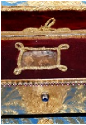
Η λειψανοθήκη του Οσίου Παναγή Μπασιά