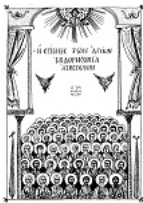
Σύναξη των Αγίων Εβδομήκοντα Αποστόλων