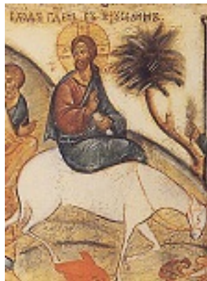
Κυριακή των Βαΐων