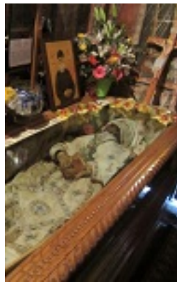
Όσιος Βησσαρίων Κορκολιάκος, ο Αγαθωνίτης