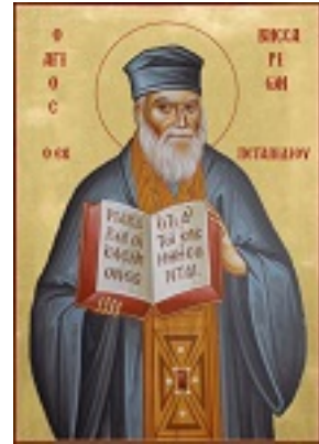
Όσιος Βησσαρίων Κορκολιάκος, ο Αγαθωνίτης