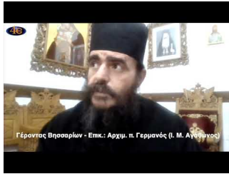
Ο Γέροντας Βησσαρίων Επικοινωνία: π. Γερμανός, Καθηγούμενος Ι. Μ. Αγάθωνος 3.3.2021