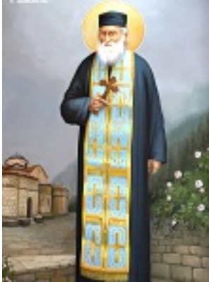
Όσιος Βησσαρίων Κορκολιάκος, ο Αγαθωνίτης