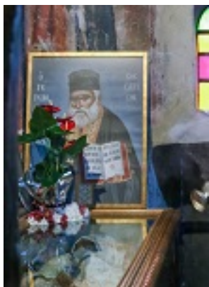
Όσιος Βησσαρίων Κορκολιάκος, ο Αγαθωνίτης