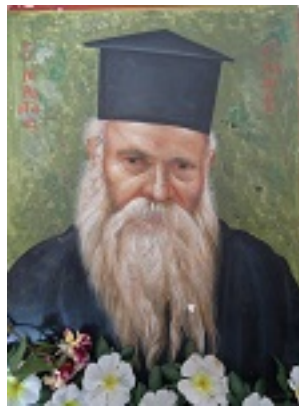
Ὅσιος Ευμένιος ο νέος ο Θεοφόρος (Σαριδάκης)