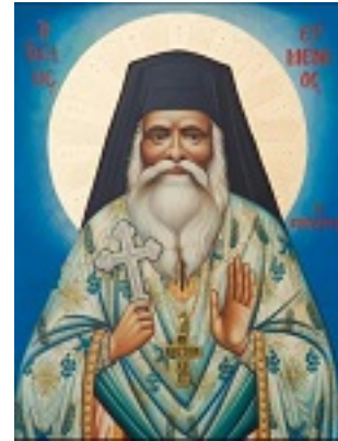
Ὅσιος Ευμένιος ο νέος ο Θεοφόρος (Σαριδάκης)