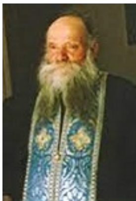
Ὅσιος Ευμένιος ο νέος ο Θεοφόρος (Σαριδάκης)