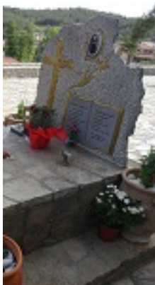
Ο τάφος του Οσίου Ευμένιου του νέου του Θεοφόρου (Σαριδάκης)