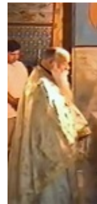
Ὅσιος Ευμένιος ο νέος ο Θεοφόρος (Σαριδάκης)