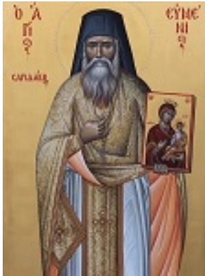
Ὅσιος Ευμένιος ο νέος ο Θεοφόρος (Σαριδάκης)