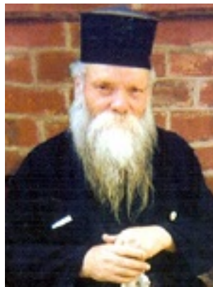
Όσιος Ευμένιος ο νέος ο Θεοφόρος (Σαριδάκης)