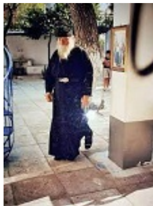
Όσιος Ευμένιος ο νέος ο Θεοφόρος (Σαριδάκης)