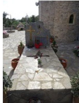
Ο τάφος του Οσίου Ευμένιου του νέου του Θεοφόρου (Σαριδάκης)