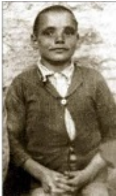
Ο Όσιος Ευμένιος ο νέος ο Θεοφόρος (Σαριδάκης) ως παιδί