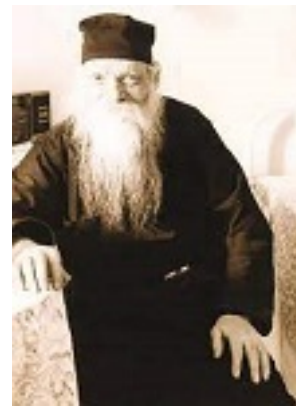
Όσιος Ευμένιος ο νέος ο Θεοφόρος (Σαριδάκης)