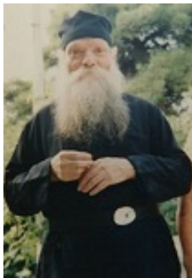
Όσιος Ευμένιος ο νέος ο Θεοφόρος (Σαριδάκης)