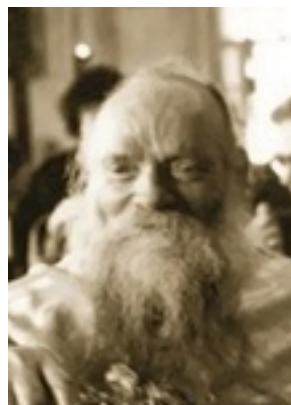
Ὅσιος Ευμένιος ο νέος ο Θεοφόρος (Σαριδάκης)