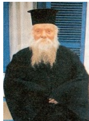
Όσιος Ευμένιος ο νέος ο Θεοφόρος (Σαριδάκης)