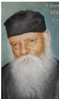
Ὅσιος Ευμένιος ο νέος ο Θεοφόρος (Σαριδάκης)