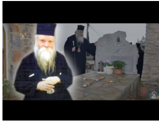
Ό Μητροπολίτης Μόρφου Νεόφυτος μιλά για τόν άγιο Γέροντα Εύμένιο (Αύγουστος 2020)