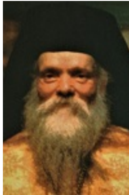
Όσιος Ευμένιος ο νέος ο Θεοφόρος (Σαριδάκης)