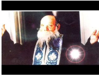
Γέροντας Ευμένιος Σαριδάκης - Ομιλεί ο ίδιος