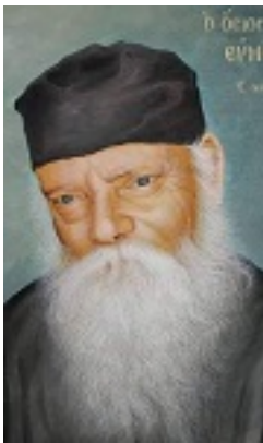
Ὅσιος Ευμένιος ο νέος ο Θεοφόρος (Σαριδάκης)