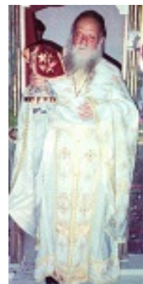
Ὅσιος Ευμένιος ο νέος ο Θεοφόρος (Σαριδάκης)