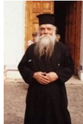
Όσιος Ευμένιος ο νέος ο Θεοφόρος (Σαριδάκης)