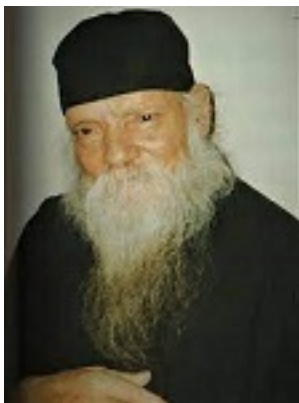
Όσιος Ευμένιος ο νέος ο Θεοφόρος (Σαριδάκης)