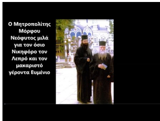
Ο όσιος Άνθιμος της Χίου, ο όσιο Νικηφόρος ο Λεπρός και ο Γέροντας Ευμένιος ο Λεπρός