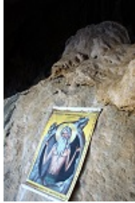
Όσιος Κοσμάς ο ερημίτης και ομολογητής (Αββακόσπηλιο)