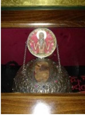
Όσιος Κοσμάς ο ερημίτης και ομολογητής (Ιερά Λείψανα)