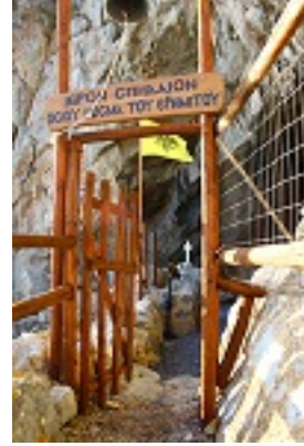
Όσιος Κοσμάς ο ερημίτης και ομολογητής (Αββακόσπηλιο)