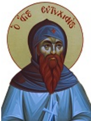
Άγιος Ευτυχιανός Οσιομάρτυρας