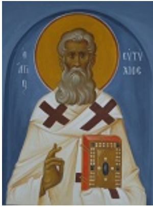
Άγιος Ευτύχιος επίσκοπος Γορτύνης