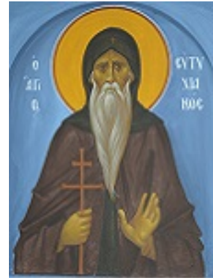
Άγιος Ευτυχιανός Οσιομάρτυρας