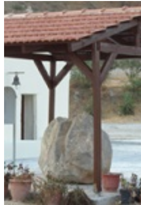
Βράχος του μαρτυρίου του Αγίου Ευτυχιανού, στην περιοχή «Μαναριά», Ιερά Μονή Οδηγήτριας.