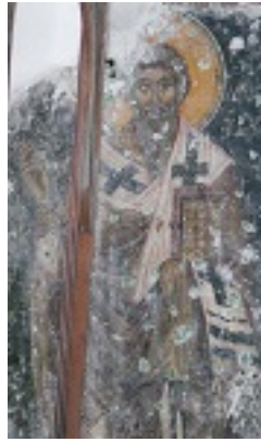
Άγιος Ευτύχιος επίσκοπος Γορτύνης - Τοιχογραφία 14ου αιώνας, Ι. Ν. Αγ. Νικολάου, Μάλες, Λασιθίου