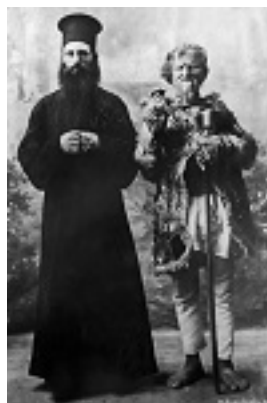
Άγιος Γεώργιος ο Προσκυνητής