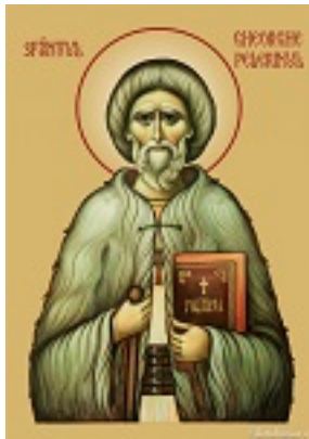
Άγιος Γεώργιος ο Προσκυνητής