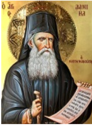
Όσιος Δανιήλ ο Κατουνακιώτης