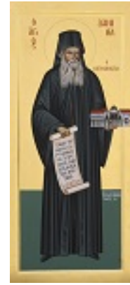
Όσιος Δανιήλ ο Κατουνακιώτης