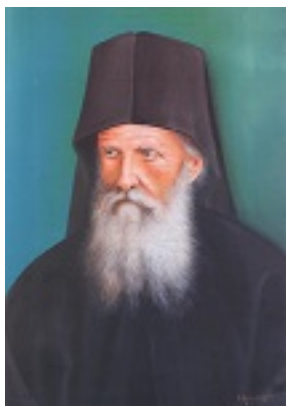
Όσιος Δανιήλ ο Κατουνακιώτης