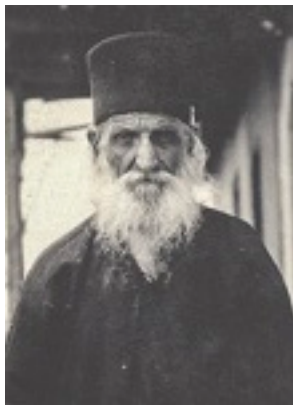
Όσιος Δανιήλ ο Κατουνακιώτης (Φωτογραφία: Νικόλας Κάλας, Άνοιξη 1929. Πηγή: Φωτογραφικό Αρχείο Ε.Λ.Ι.Α.)