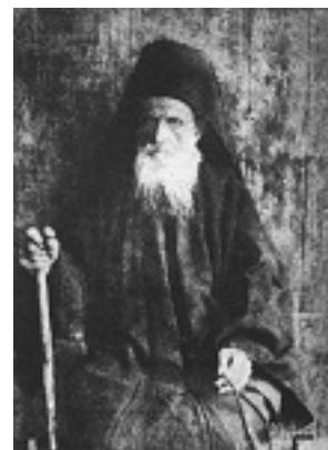
Όσιος Δανιήλ ο Κατουνακιώτης