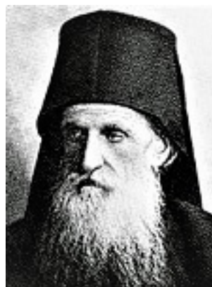
Όσιος Δανιήλ ο Κατουνακιώτης