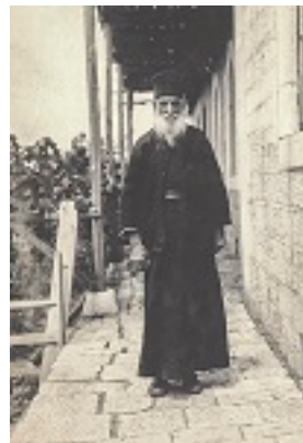
Όσιος Δανιήλ ο Κατουνακιώτης (Φωτογραφία: Νικόλας Κάλας, Άνοιξη 1929. Πηγή: Φωτογραφικό Αρχείο Ε.Λ.Ι.Α.)