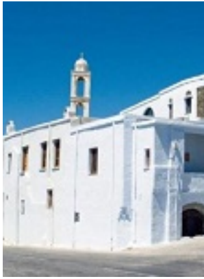
Σύναξη της Παναγίας Κυρίας των Αγγέλων στην Τήνο