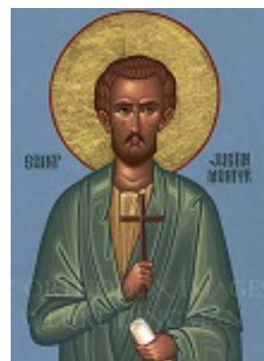
Άγιος Ιουστίνος ο Απολογητής και φιλόσοφος