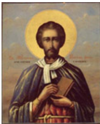
Άγιος Ιουστίνος ο Απολογητής και φιλόσοφος