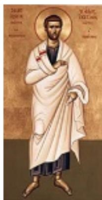
Άγιος Ιουστίνος ο Απολογητής και φιλόσοφος