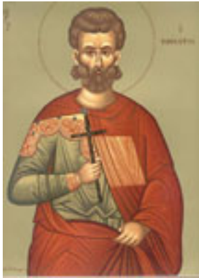
Άγιος Ιουστίνος ο Απολογητής και φιλόσοφος