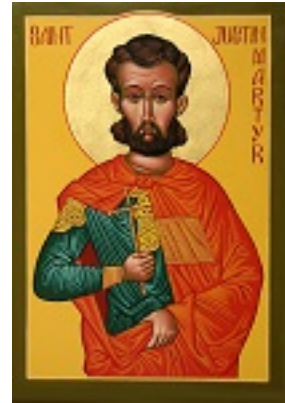
Άγιος Ιουστίνος ο Απολογητής και φιλόσοφος