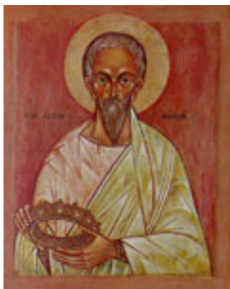
Άγιος Ιουστίνος ο Απολογητής και φιλόσοφος