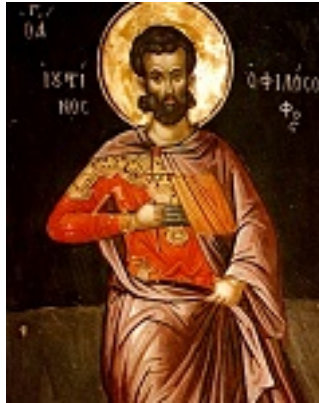
Άγιος Ιουστίνος ο Απολογητής και φιλόσοφος